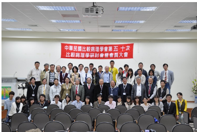
許教授參加第五十次擴大舉辦國際比較病理研討會。