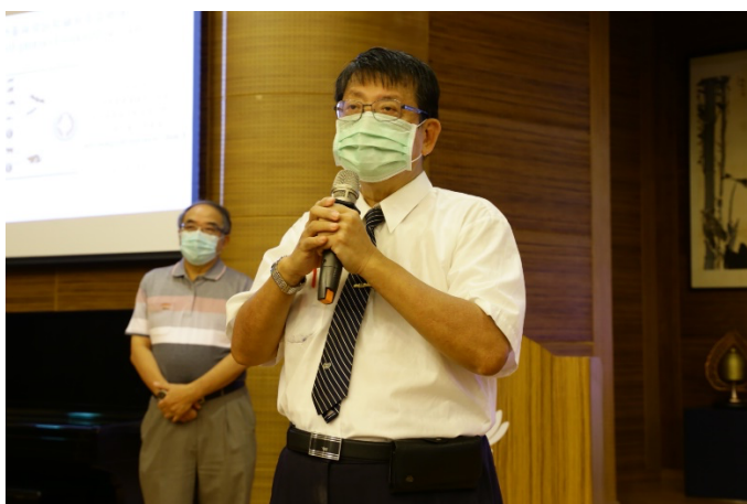
許教授主持我在慈濟醫院晨會演講。